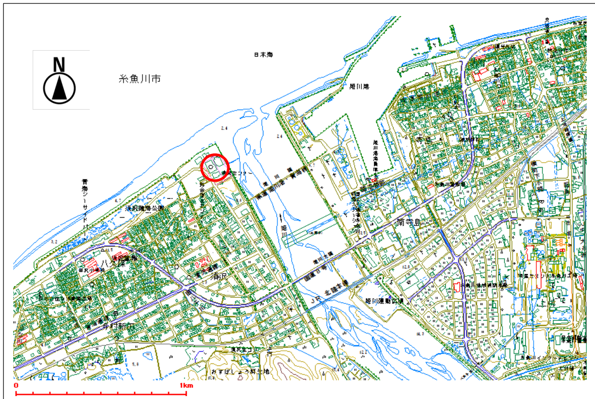
参考：周辺の用途地域図